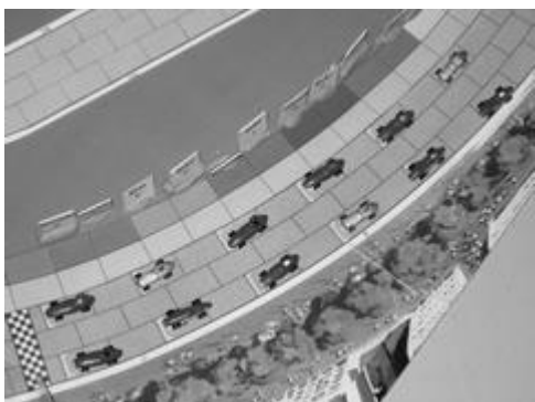
La grille de départ, belle vue aérienne.