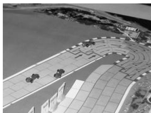
1er tour, 7e virage: Radio (Tremblay-Torrari) en tête, Villerossi (Wolf-Torrari) et Fiverosa (Tremblay-Torrari) derrière.