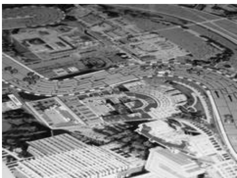
1er tour, 2e et 3e virages: les 8 voitures encore sur la piste.