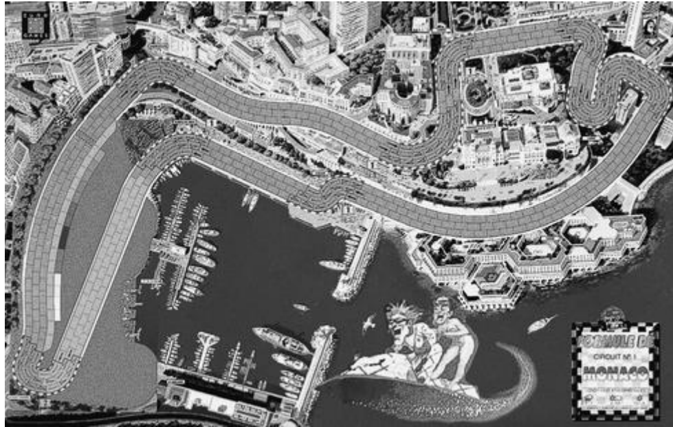
Le circuit de Monte-Carlo, version 1950.

SEMAINE 19 - L'été terminé, les activités reprennent au sein de la Ligue Prout, avec la suite de la quatrième saison du championnat FD1-évolution, 1956. La dernière course, l' International Trophy , se déroulait voilà maintenant presque deux mois. Faire une soirée fut difficile, tellement tout un chacun était occupé. Tous, excepté Jessy qui n'en pouvait plus d'attendre!