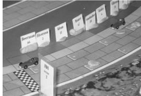
Fin du premier tour: les deux voitures de l'écurie Tremblay, en route pour le second tour.