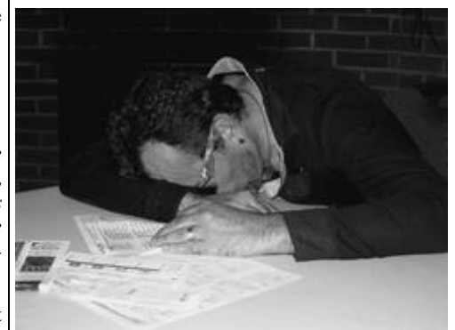
Après, la joie, tombe la fatigue. Ils ne sont plus très fort les p'tits vieux, de nos jours!