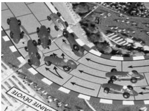
1er tour, 1er virage: le triple accident en début de course.